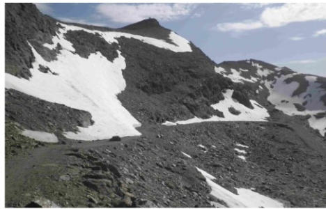
Carhuela del Veleta 29-6 -16