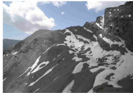
Corral del Veleta 29-6-16