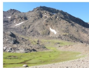
Corral del Veleta, Picón de Jerez y Tajos de la Virgen 13, 14 -7-2016