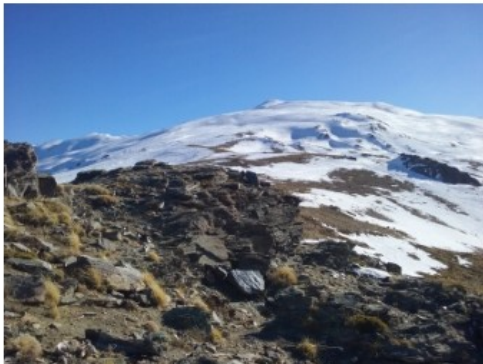
Cerro del Caballo