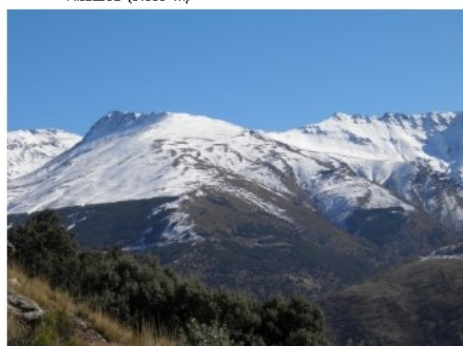
Mojón Alto y Puntal de Vacaras