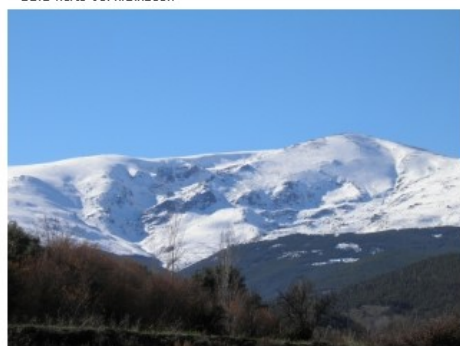
Picón de Jerez (3.088 m)