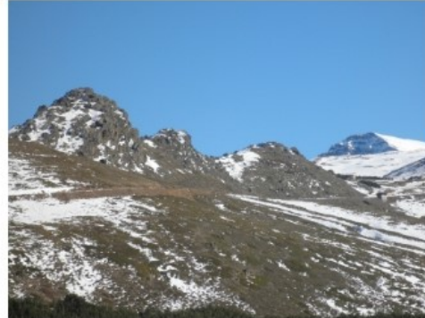
Pañones de San Francisco y Mulhacén