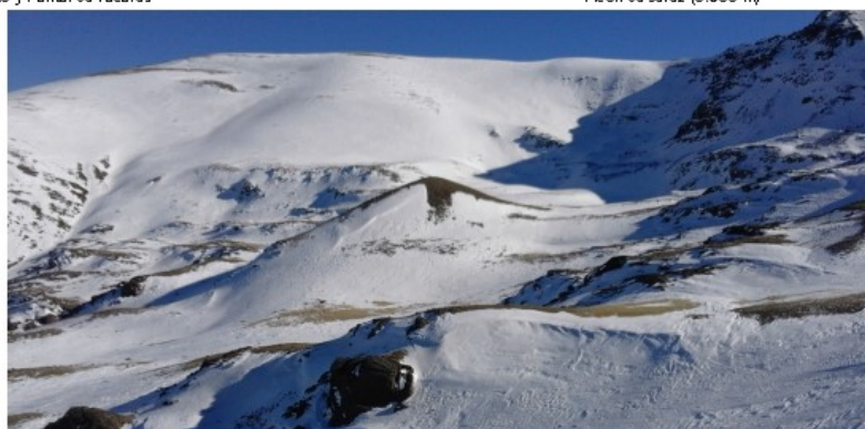
Lavaderos de la Reina