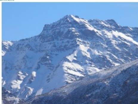
Akazaba (3.369 m)