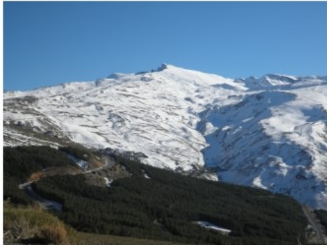
Valeta (3.396 m)