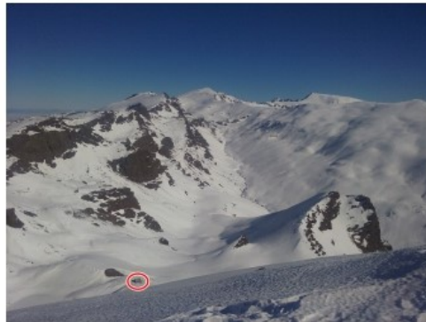
Refugio del Caballo y valle del río Lanjarón