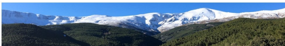
Picón de Jerez 10-1-18