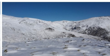
Acceso a 7 Lagunas desde Trevélez (La Campiñuela) 10-1-18