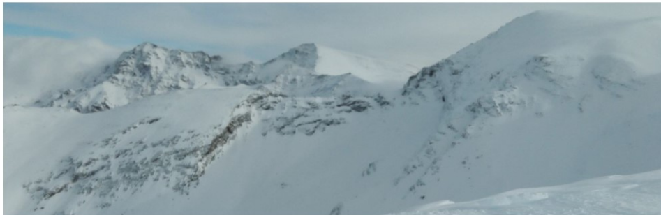
Cara norte Alcazaba, Mulhacén y cerro de Los Machos 9-1-18