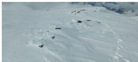
Corral y Posiciones del Veleta 9-1-18