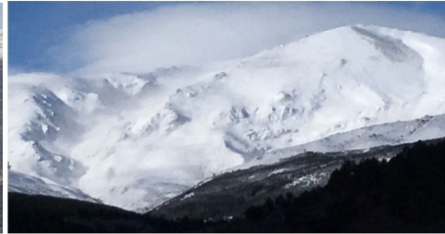
Cerro del Caballo y Picón de Jerez 6-3-18

¡Atención! condiciones extremas para el fin de semana, hielo, riesgo de aludes y fuerte ventisca