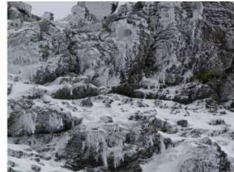
Alud de nieve en las proximidades de Pradollano, río Dilar y rocas con hielo a 2400m 5-3-18