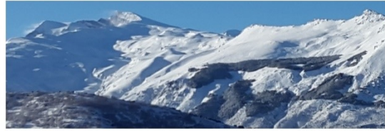
Vacares, Alcazaba, Veleta, barranco de San Juan y cabecera río Monachil 7-3-18