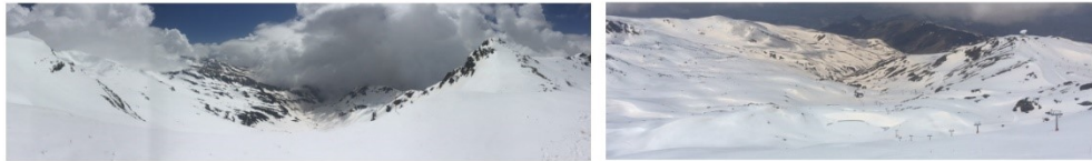
Cara sur y cara oeste desde La Canhuela 8 - 5 -18

¡Atención ! Riesgo alto de aludes de primavera sobre todo en las horas más cálidas del día, rotura de cornisas, rimayas y puentes de nieve sobre cursos de agua. Se aconseja extremar la precaución