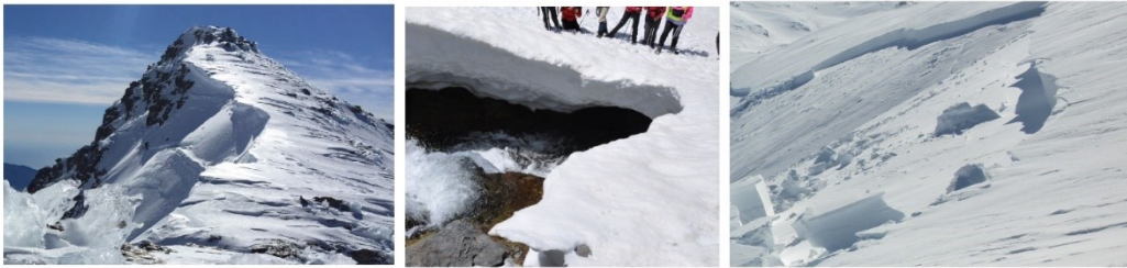
Aristas, puentes de nieve, aludes, rimayas, la sierra muy bonita pero peligrosa

¡Atención ! Riesgo alto de aludes de primavera sobre todo en las horas más cálidas del día, rotura de cornisas, rimayas y puentes de nieve sobre cursos de agua. Se aconseja extremar la precaución