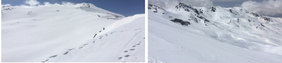
Zona del Veleta y Tajos del La Virgen 8 - 5 -18