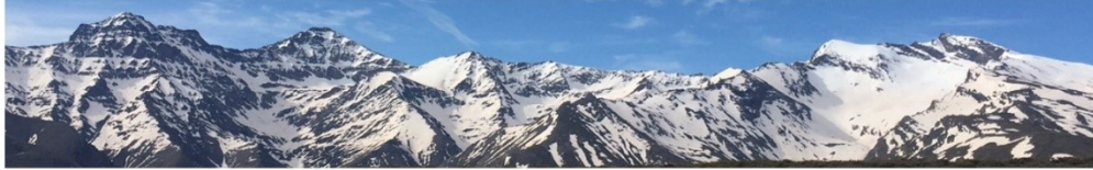
Vertiente norte desde La Alcazaba al Veleta 14 - 5 -18