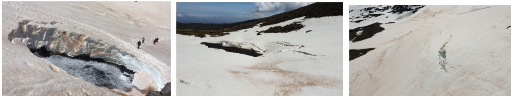
Aristas, puentes de nieve, aludes, rimayas, la sierra muy bonita pero peligrosa

¡Atención ! Se aconseja evitar situaciones de riesgo, posibilidad de desprendimientos de rocas en paredes, rotura de cornisas, rimayas y puentes de nieve sobre cursos de agua. Extreme la precaución