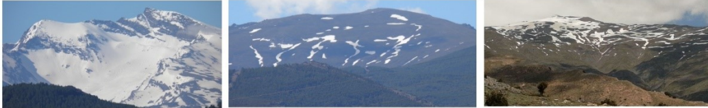
Corral del Veleta, Chullo, Caballo y Picón de Jerez 15-5-18