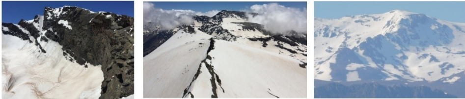
Corral y cumbre del Veleta y Cartujo 6 - 6 -18