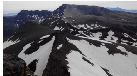
Carhueta del Veleta, vistas desde la cumbre del Veleta, acceso al corral del Veleta y Tajos de la Virgen 5 - 7-18