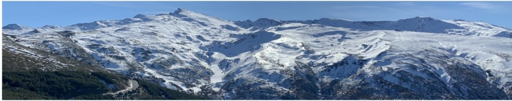
Veleta, tajos de la Virgen y Cartujo 18- 12 -18