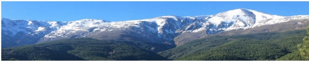
De la Loma de las Albardas al Picón de Jerez 19-12-18