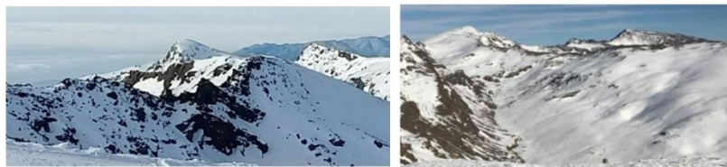
Tajos de la Virgen y valle del Lanjarón 24 - 12 -18