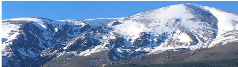
Picón de Jerez y cabecera río Lanjarón 25-12-18