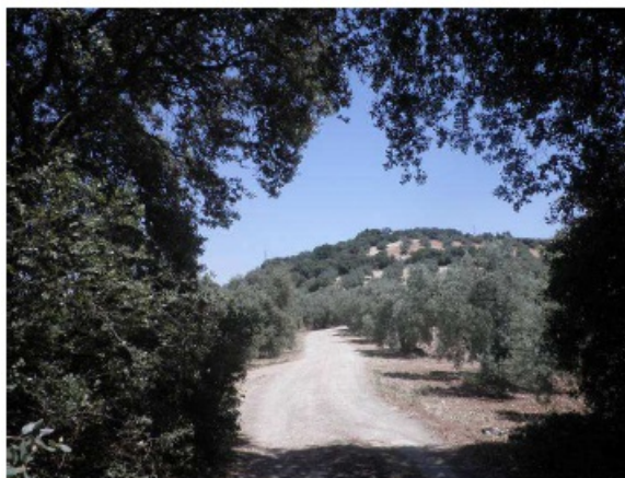
Foto - GR 249. Etapa 15 Variante 249.2 Cuevas de San Marcos