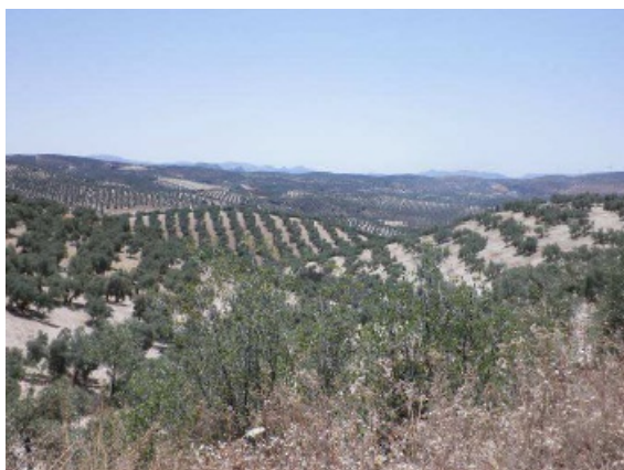
Foto - GR 249. Etapa 15 Variante 249.2 Cuevas de San Marcos