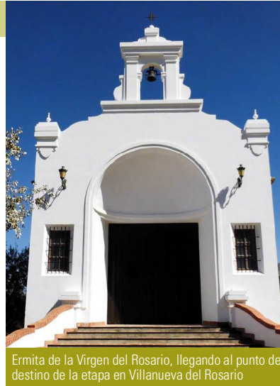
Ermita de la Virgen del Rosario, llegando al punto de destino de la etapa en Villanueva del Rosario

El recorrido sigue y llega a una nueva hondonada, el Hoyo Virote, rodeado de buenos ejemplares de pinos carrascos, encinares muy densos y grandes cornicabras, junto a los quejigos que dan nombre a toda la zona. Localmente llaman vagas a las cañadas, como la que surge de este nuevo llano y asciende, bajo un tupido bosque de quejigos que sumerge al senderista en un intrincado laberinto de troncos enhiestos. Un nuevo llano, donde se empieza a intuir la altitud, y se llega a una alambrada coincidente con la linde de términos que se ha comentado, que dirige al senderista hacia la izquierda en pos de una angarilla que da paso a la Era de Juan Moreno (km 6.9), prueba de la actividad agrícola asociada a estos terrenos tan marginales para el cultivo.