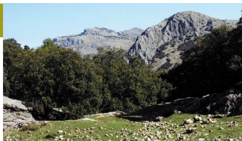
La Sierra de San Jorge y el Tajo Tello

El sendero sigue teniendo una componente oeste relevante, pero para llegar al pueblo gira