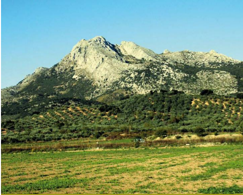
La Sierra del Jobo y el Pico Chamizo desde la nava de Alfarnate