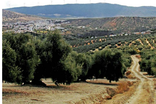
Villanueva de Algaidas desde el GR-249 en su ascenso al Cerro de las Cruces

Pocos lugares pueden ofrecer una vista tan amplia, perfectamente explicada en un cartel panorámico, de la zona de campiña de las provincias de Córdoba y Granada, cuando,