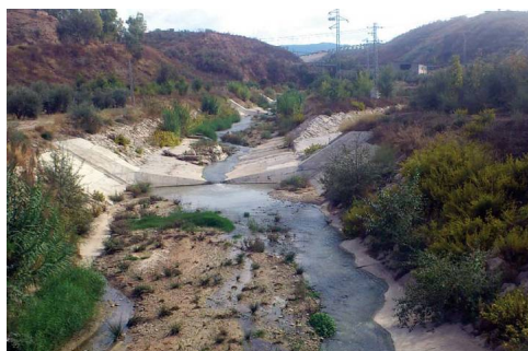
El Río Burriana en Cuevas Bajas, muy cerca de su desembocadura en el Genil

Al pueblo se entra desde el sureste por la Calle Archidona. Se pasa por la Plaza principal con la Iglesia de San Juan Bautista con su fachada de ladrillo visto y la torre barroca del reloj con la espadaña de tres campanas. La etapa termina al lado del Río Burriana, casi donde contacta con el Genil, en una avenida profusamente dotada de cartelera alusiva al senderismo y otras actividades asociadas al medio natural de las que cabe destacar el piragüismo. ○