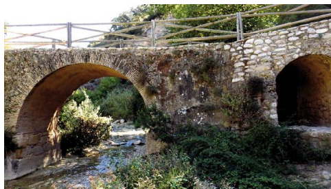
Puente sobre el río Burriana

Para cruzar el cauce se construyó en época medieval el Puente Viejo aprovechando como hombros dos salientes de la roca madre. Es una bonita infraestructura con un ojo principal y dos