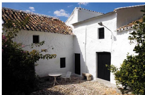
La alquería de El Cedrón contiene algunos elementos de la arquitectura tradicional tan bellos como este rincón