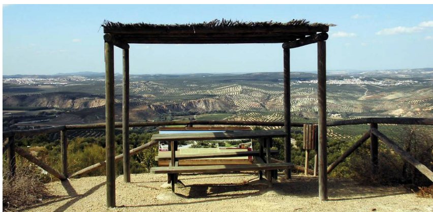
Un fantástico lugar desde el que ver el Valle del Guadalquivir, el Mirador del Cedrón

al lado de los cortados de arenisca. Luego cruza el Río Burriana por el Puente Viejo y asciende en busca de La Atalaya, con un interesante mirador sobre lo ya recorrido. En este punto se separa del GR-7 E-4 (km 1.5) pero sigue con el Camino Mozárabe.