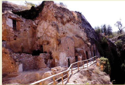
Iglesia Rupestre Mozárabe entre Villanueva de Algaidas y La Atalaya, en los primeros compases del día

El PR-A 129 Circular de Villanueva de Algaidas es un recorrido de 7 kilómetros y medio que une los dos núcleos cercanos y coincide con el