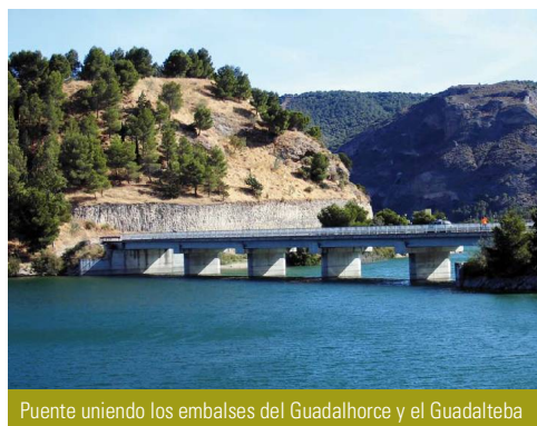
Puente uniendo los embalses del Guadalhorce y el Guadalteba

El sendero se amolda a las curvas de nivel y se aproxima cada vez más al agua, pero conviene mantenerse una decena de metros por encima hasta llegar de nuevo a la carretera.