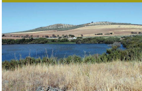
Secano y olivar rodean la Reserva Natural Laguna de Camuñas

aflorar la roca madre. Las encinas de gran porte no son muy frecuentes, más bien aparecen como almárcigas (bosquetes de arbolitos de la misma edad muy próximos entre sí) o como matorral. Son muy frecuentes las esparteras también.