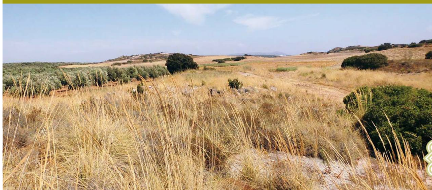
Esparteras y herrizas al lado de la Gran Senda de Málaga