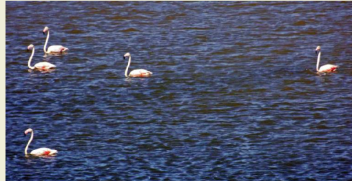
Flamencos nadando en una zona de aguas profundas

Se publicita una ruta circular (no balizada) para conocer todos los enclaves de la Reserva