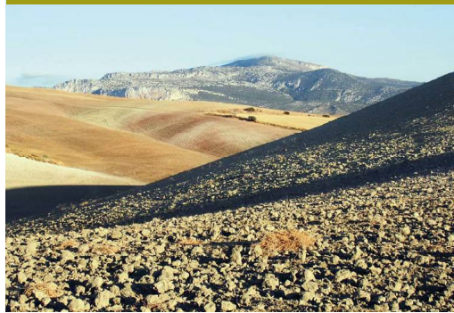
Tierras arcillosas de diversos colores con la sierra detrás

zona tendría en tiempos un olivar productivo, pero ahora los arbolitos se mezclan con bolinas, jaras, retamas, tomillos y aulagas en esta loma tan expuesta a los vientos. Cuando comienza el descenso el paisaje es otro, con cerros y cerros de tierra de labor de diferentes tonalidades hasta que se llega al Arroyo del Capitán, al lado de la carretera de nuevo.