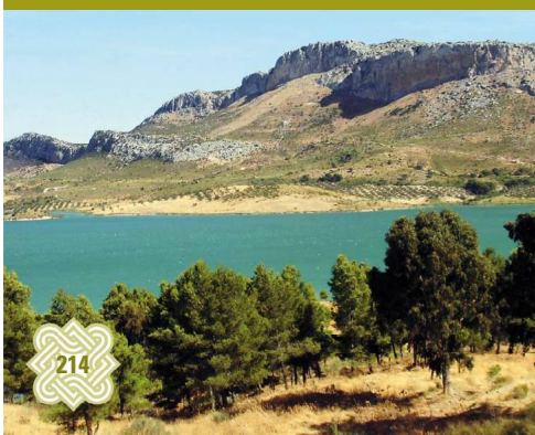
Tras el pantano del Guadalhorce, la línea oblicua de la etapa posterior

La A-7286 se debe seguir hacia la izquierda durante unos dos kilómetros y medio, obviando dos desvíos a la derecha, primero el que se dirige al Parque de Guadalteba y después la carreterita de servicio que va a las cabeceras de los pantanos, destino común con la etapa. En el punto kilométrico 17.5 se abandona el asfalto. Hay dos cortijadas en este tramo. La primera se deja a la derecha, la de Rebolo. Después se entra enseguida en el pinar, que cada metro gana en densidad y lozanía de los pinos. Comienza a aparecer el sotobosque, pero la mejor zona para constatar su antigua diversidad es un berrocal de rocas areniscas en el que no se reforestó. En el ascenso en zigzag hasta la era y las ruinas del Cortijo del Chopo (km 20.5), al cobijo de las peñas, medra un interesante matorral de tomillo, espino negro, palmito y esparto.