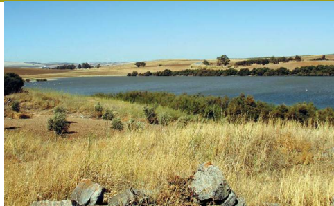
Laguna de Camuñas desde un altozano al lado del camino

Los pantanos, por el contrario, cuentan con el problema de sus grandes variaciones de nivel, por lo que la vegetación de las orillas puede llegar a ser inexistente en las zonas de cabecera, de bastante pendiente y muy rocosas, que son las que se ven en la etapa. En las colas de los pantanos de Guadalteba, Guadalhorce y Conde de Guadalhorce (sobre todo en estos dos últimos) se localizan densos bosques de tarajes en los puntos en los que Guadalhorce y Turón, respectivamente, desembocan. De esta forma se ha propiciado el