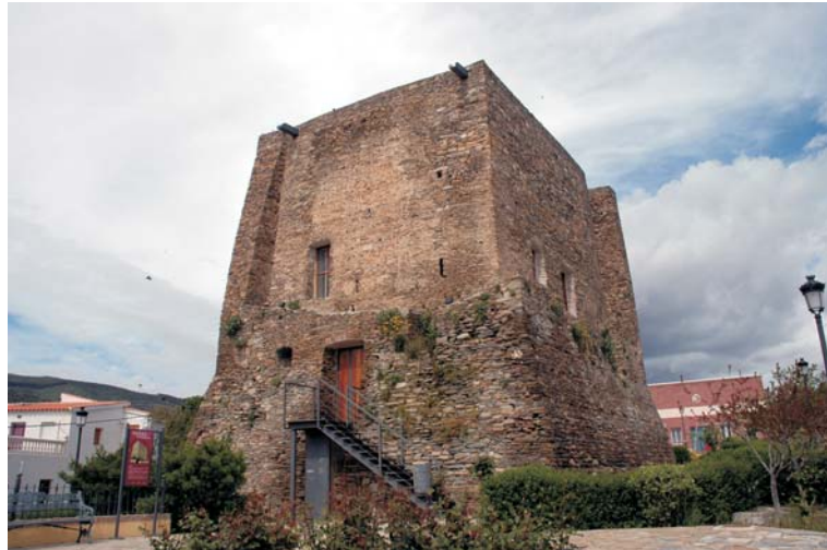
El Caño de Tahal. S. XVIII

las ruinas de una antigua fortaleza musulmana. En la actualidad se ha acondicionado como Centro de Interpretación de "Torre de Tahal".