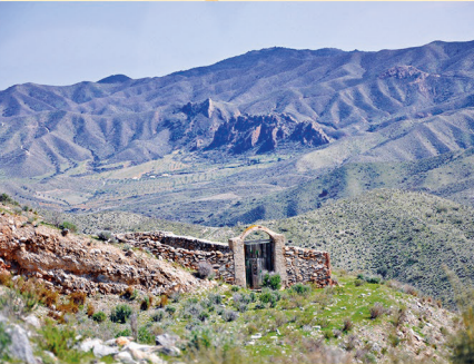
VISTAS DESDE LAS LOMAS (Cerramiento de Ganado)