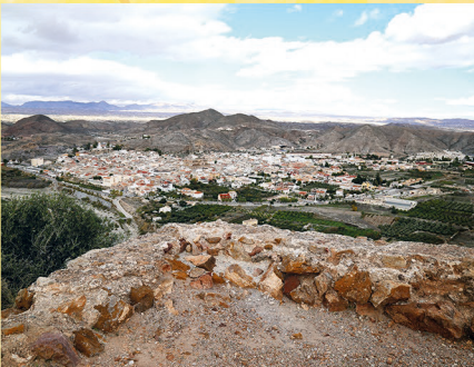
PANORÁMICA DE CANTORIA