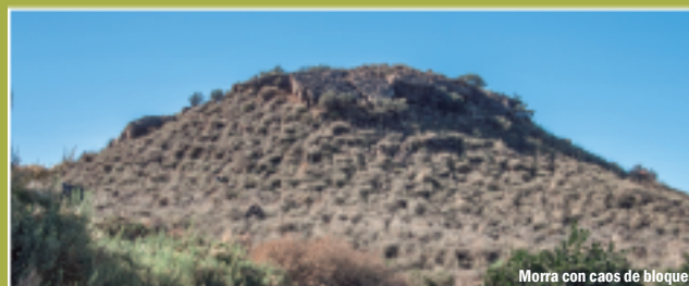
Morra con caos de bloques