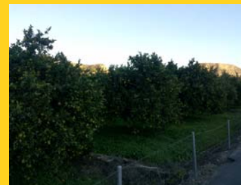
Plantación de naranjos en la vega