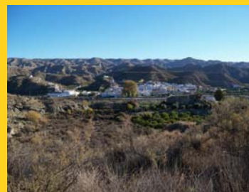
Santa Cruz de Marchena