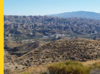
Paisaje árido entorno de Santa Cruz