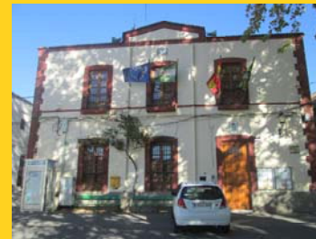
Ayuntamiento de Santa Cruz