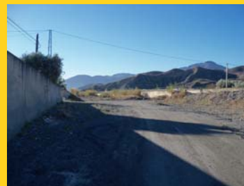
Estado actual Río Nacimiento