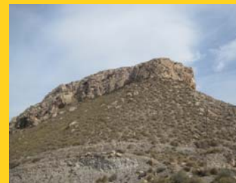
Arrecife fósil de Mesa Roldán