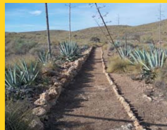
Tramo de senda Cañada de Marcos