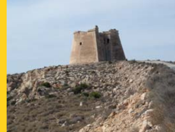
Torreón de Mesa Roldán