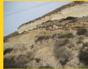
Afloramiento de "Playas fósiles"