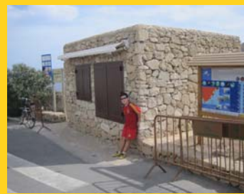
Punto de información Los Muertos