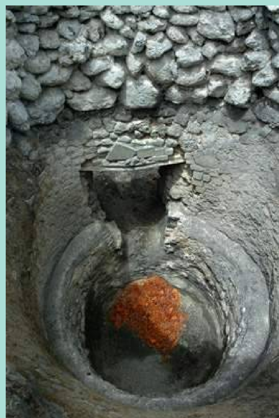
Interior de una calera en uso.

En la confluencia de la Cañada de Fuente Techá y la pista forestal de Sierra Prieta, se inicia este recorrido que permite culminar el pico de esta Sierra. Junto a la fuente una antigua calera abandonada nos delata uno de los usos de las rocas calizas del entorno, el de convertirlas en cal para el blanqueo de las casas.