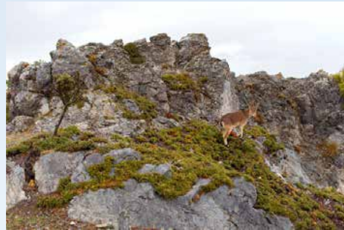
Vista Entre Sierras

Actualmente desde la A7, se puede coger el desvío hacia Molvizar-Ítrabo, ya que esta vía se une a la carretera de la Cabra entre Jete y Otívar y al llegar a este cruce coger hacia Otívar-Lentegi.