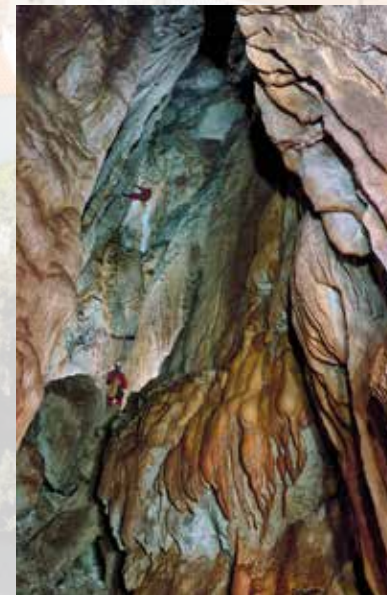
Cima del Perro