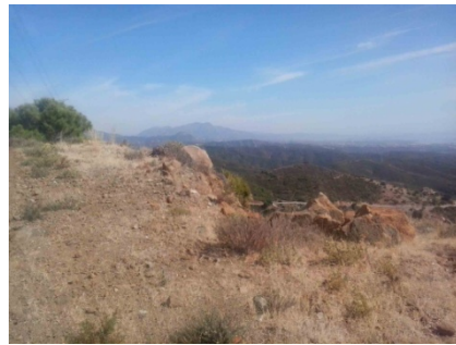
WPT4. Fin de coincidencia con GR 249 Etapa 29