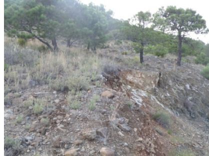
WPT2. Tramo de senda perdida