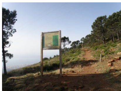
WPT7. Fin de Sendero y enlace con Sendero Salvador Guerrero y SL-A 168