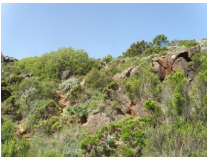
WPT5. Tramo de senda confuso