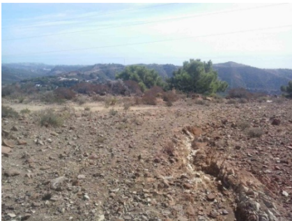
WPT3. Inicio de coincidencia con GR 249 Etapa 29