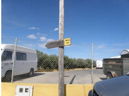
WPT1. Inicio de sendero