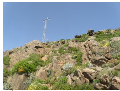
WPT6. Última parte del tramo de senda confuso