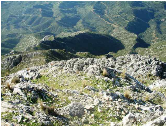
WPT3. Inicio de coincidencia con PR-A 135