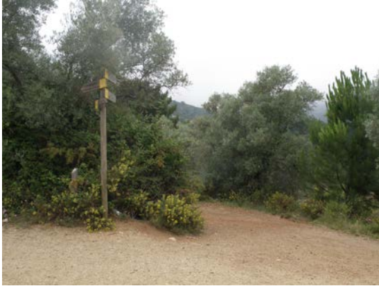
WPT1. Inicio de sendero y de coincidencia con GR 243 Etapa 8, PR-A 167. Enlace con PR-A 169.