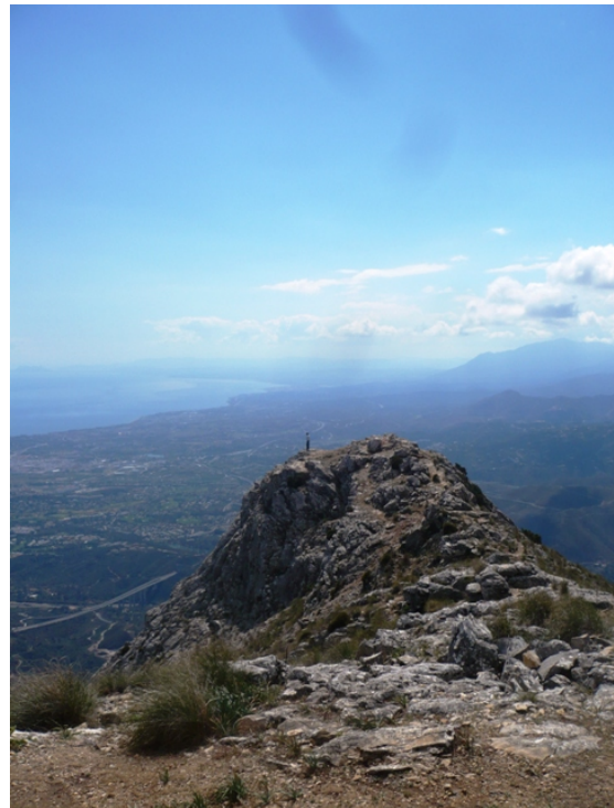
WPT4. Fin de sendero y de coincidencia con PR-A 135