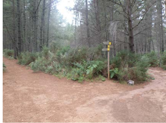
WPT2. Fin de coincidencia con GR 243 Etapa 8 y PR-A 167