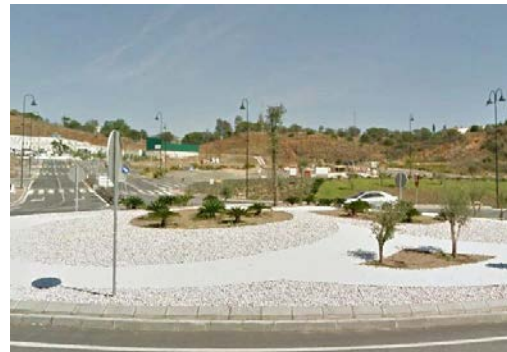
WPT4. Fin de coincidencia con carretera