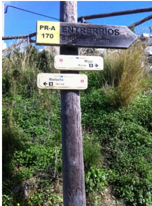
WPT1. Inicio de sendero y de coincidencia con GR 249 Etapa 32 y GR 92 E-12 Etapa Ojén - Mijas