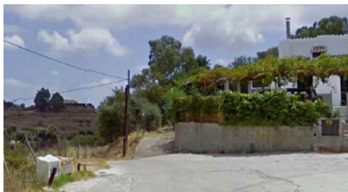
WPT5. Inicio carreteras de urbanizaciones