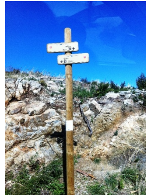
WPT2. Inicio de carretera