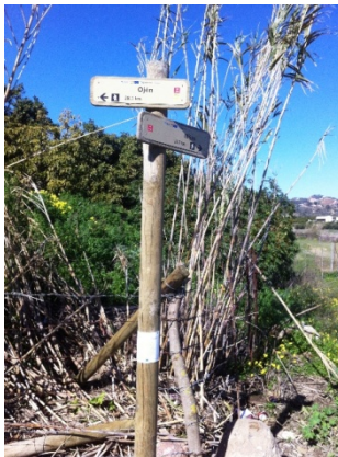
WPT3. Cruce de río y fin de coincidencia con GR 249 Etapa 32 y GR 92 E-12 Etapa Ojén - Mijas