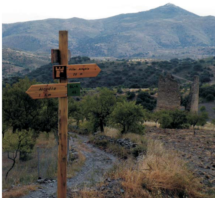
SL-A 46 "Torre de Alhabia"

un cruce dejamos la pista por la derecha cogiendo el antiguo Camino Real empedrado y seguimos por él hasta salir de nuevo a la carretera ya junto al pueblo. Pasaremos por la enorme era que hay a la entrada del mismo y bajaremos callejeando para volver al punto de origen en La Fuente.