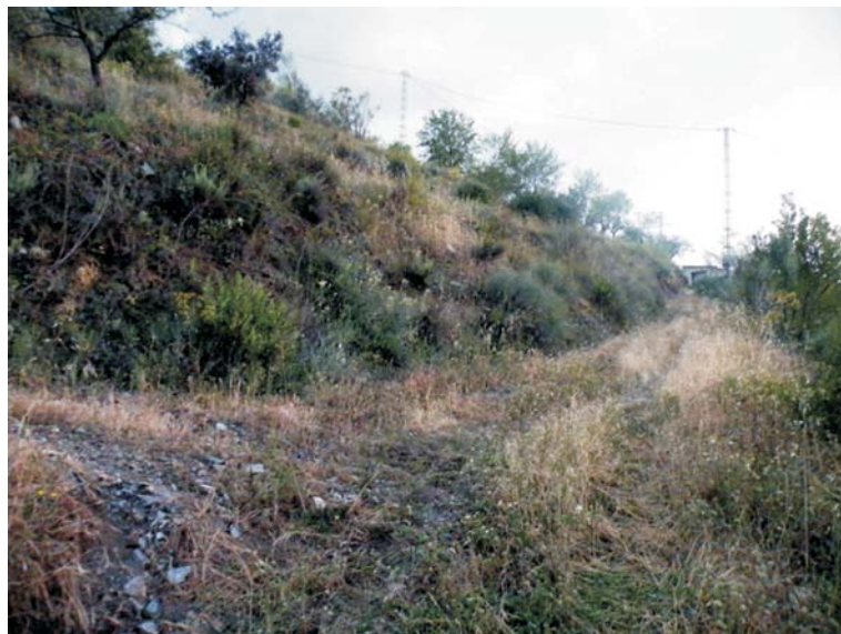
WPT 19 / UTM: 0565499, 4121508 / KM: 5,035