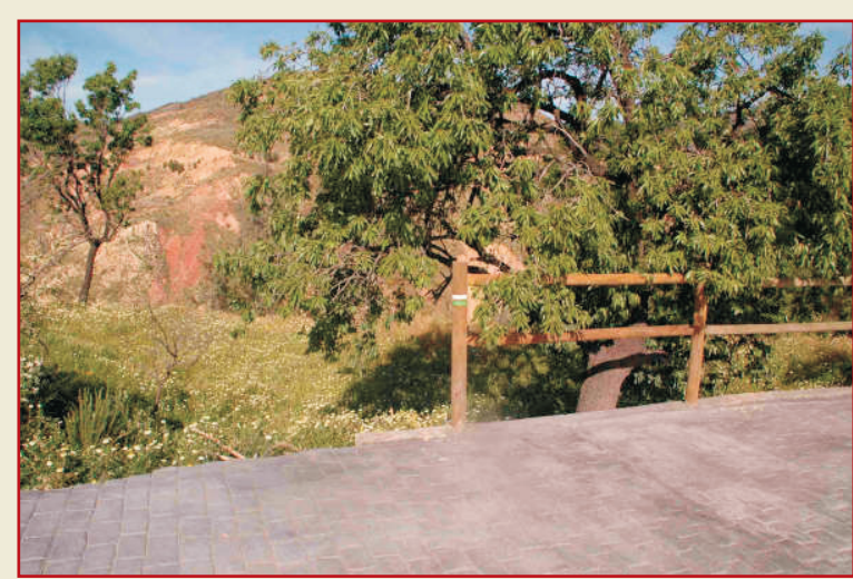
Baliza de sendero a la salida de Almócita