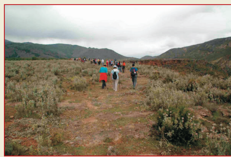
Recorriendo el sendero