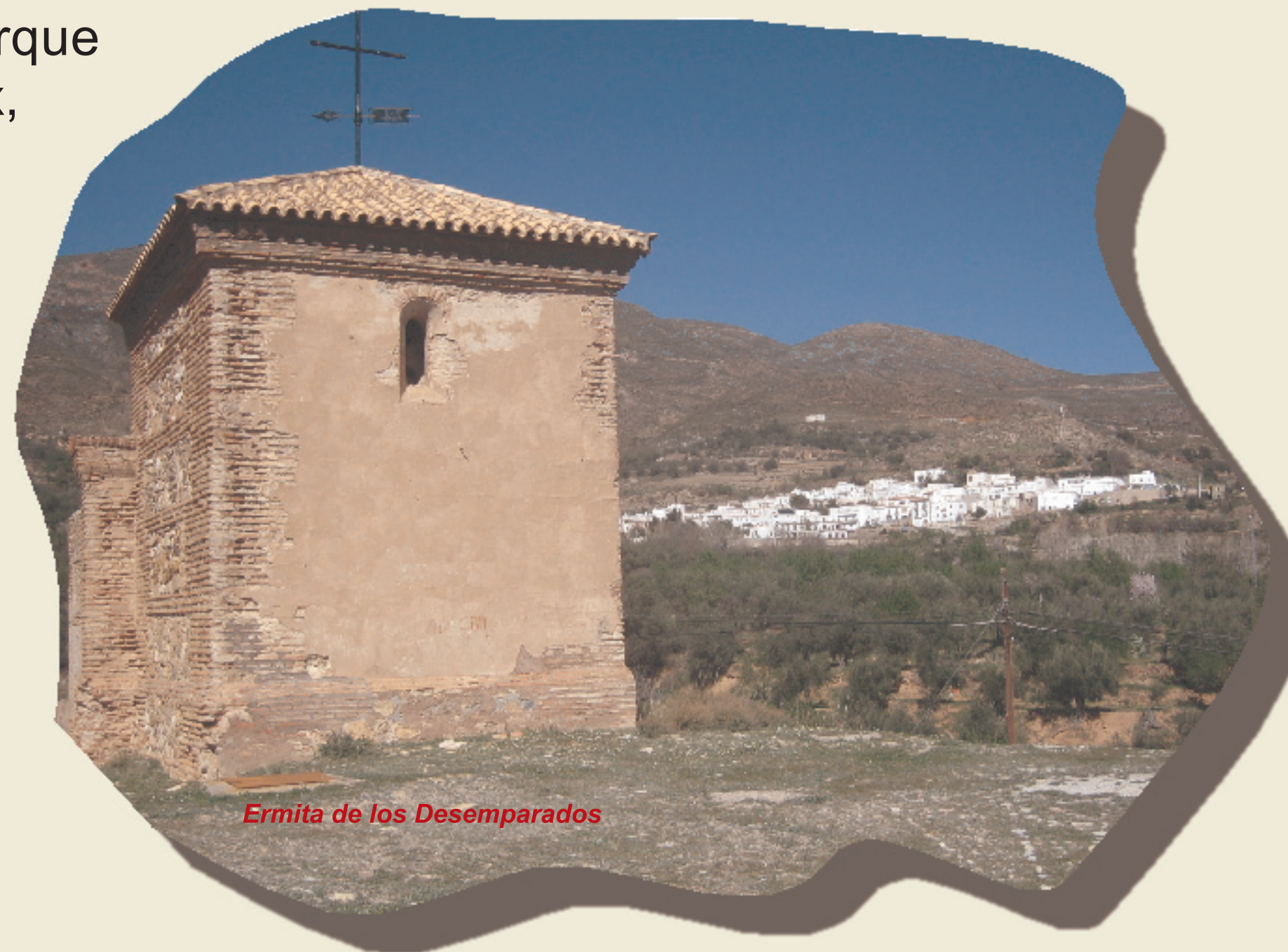
Ermita de los Desemparados