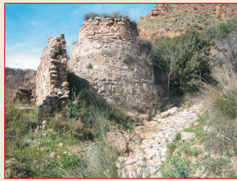
Molino del Río