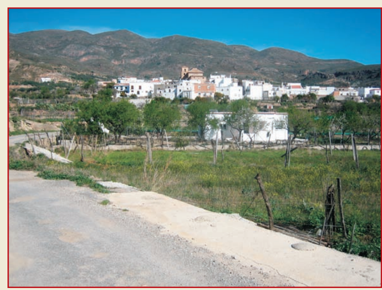
Vista de Almócita