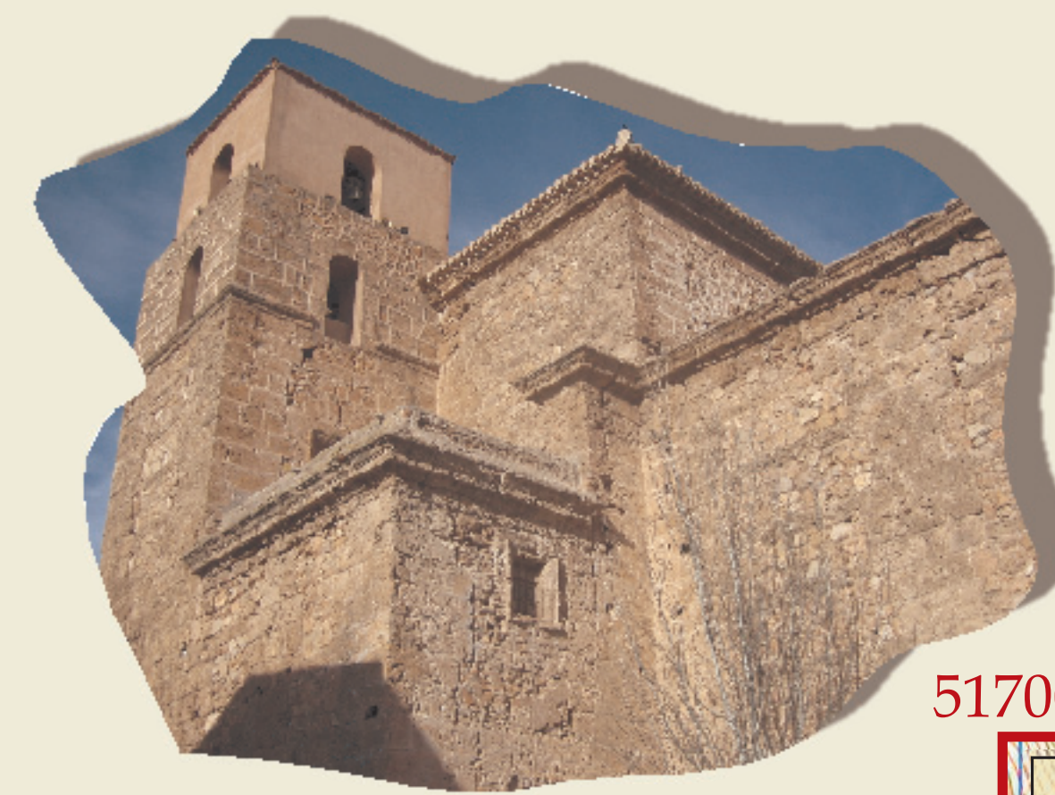
IGLESIA DE N.ª SRA. DE LA MISERICORDIA

En el recorrido podrá encontrar otros tipos de señalización, ya que hay tramos coincidentes con otros senderos, el GR -140 y el GR- 142 por lo que, tendrá que guiarse por el tipo de baliza que hay junto a esta señal de sendero.