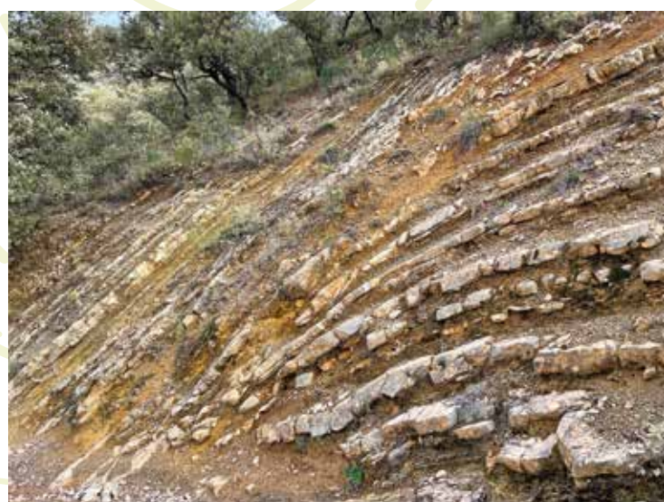
Pliegues de la roca kárstica que muestran la compleja estructura geológica de esta sierra