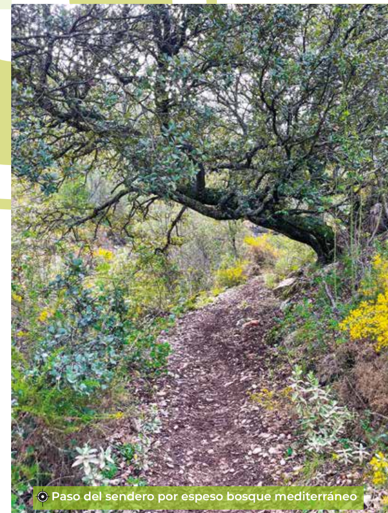
Paso del sendero por espeso bosque mediterráneo

GPS Antiguas Escuelas del Salado: 37.40092088395509, -4.177961644281666