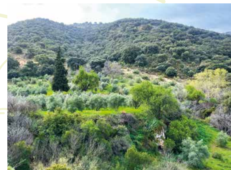
Balcón travertínico de la Huertezuela