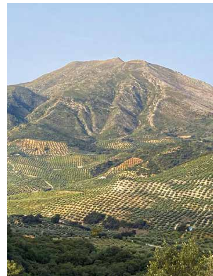
Vistas de la Tiñosa desde Albayate