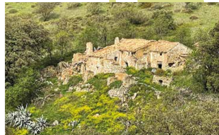
Cortijo de las Eras Altas

Es este un buen lugar para un nuevo descanso y para reponer fuerzas.