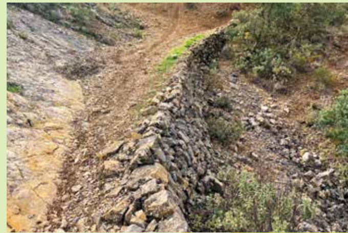
Ante el muro en mampostería para salvar el gran desnivel del terreno

En el último tramo, la vereda vuelve a ponerse empinada y ya a 1.050 metros de altitud, se abre el paisaje a las tierras del sur: estamos en el cruce de caminos en el que antiguamente estaba la llamada “Cruz de los Panaderos”. De este a oeste discurre el que nos llevaría a la cumbre de Sierra Albayate, llamada “Cerro del Muchacho” o “La Pelona” y en dirección Sur, el que nos acerca a parajes como “Valdeinfierno” y “Huerta de Pedrajas”, o nos lleva directamente hasta Algarinejo pasando por la Poyata.