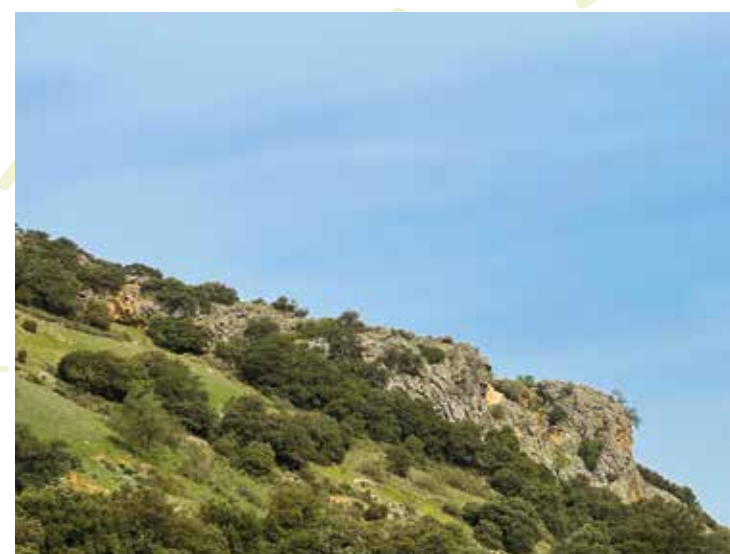
Restos de fortificación árabe (siglos IX y X)