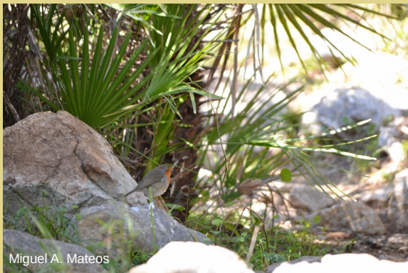
Miguel A. Mateos

La zona del Prado de la Escribana, a la menor cota, es mucho más abierta, lo que facilita la observación de fauna. Subiendo por el arroyo del Infiernillo para regresar al pueblo, hay alcornoques de solana y umbría, pinar de pino resinero y matorrales de jaras y brezos.