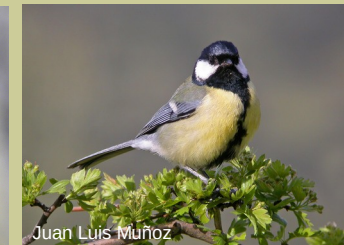
Juan Luis Muñoz

Distancia total aproximada: 5,8 km Tiempo de marcha estimado: 3 h Tipo de recorrido: circular Modalidad: a pie