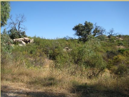
Zona de bolos graníticos