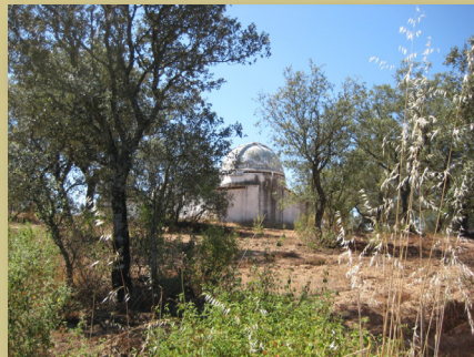
Construcción en finca Puerto Marte