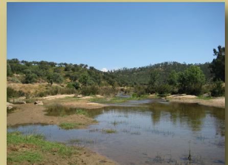
Paraje de La Rivera de Cala