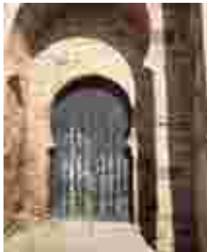
Puerta del Castillo

El sendero del Bronce está situado en Baños de la Encina, en plena Sierra Morena. Discurre por las cercanías del Pantano del Rumblar, enclave natural, y donde destaca el paisaje y los restos arqueológicos de "Piedra Bermeja" de la cultura Argárico, vestigio de la edad del Bronce. Su entorno está formado por dehesa, destacando pinos y eucaliptos de repoblación, y por zonas de olivar.