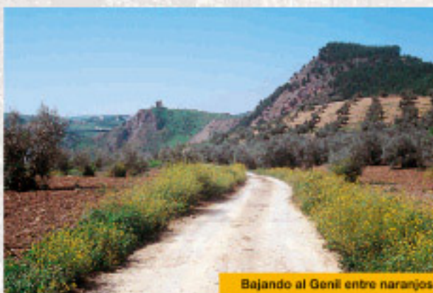
Bajando al Genil entre naranjos.