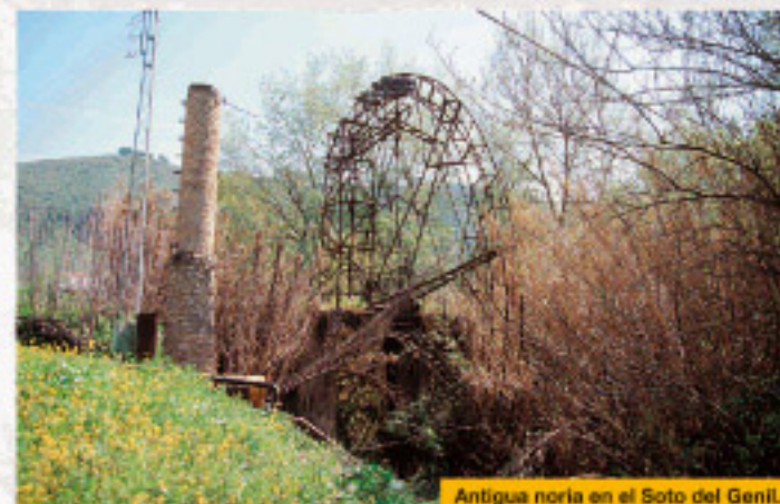
Antigua noria en el Soto del Genil.

Pasaremos junto a las ruinas del cortijo y andaremos al lado del río, de variada vegetación donde anidan algunas especies de aves acuáticas. Llegaremos al espectacular puente de la carretera de Málaga y a los restos de una antigua noria, comenzaremos un ascenso con vistas del lo que antaño fue el castillo árabe de Gómez Arias, quedando enfrente el Torreón medieval, conocido por el yacimiento del Hacho. El sendero discurre entre huertos y una antigua cantera. Después de algunos cruces llegaremos a conectar con una carretera asfalta y con el cortijo de la Molina, giraremos a la izquierda y caminaremos por ella, entre olivos y pinos, hasta llegar de nuevo al camping de Los Caños de Benamejí.