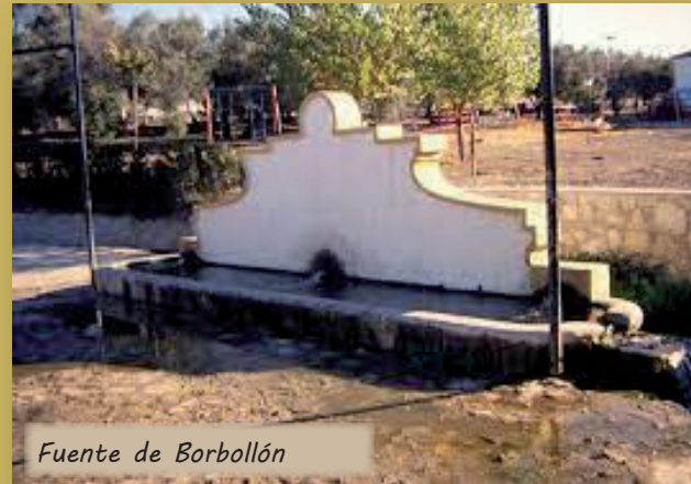
Fuente de Borbollón