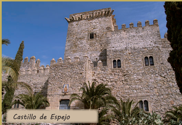
Castillo de Espejo