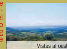
Vistas al oeste

We move towards the Southeast where the pines are giving way to mount under Mediterranean, to cross again AP-7, by a tunnel and the Cañada Real of Los Barrios to Estepona, and to return to the starting point in the urbanization, crossing before the stream of Martagina.