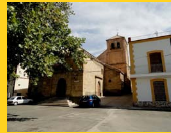
Iglesia Santa María y Ayuntamiento