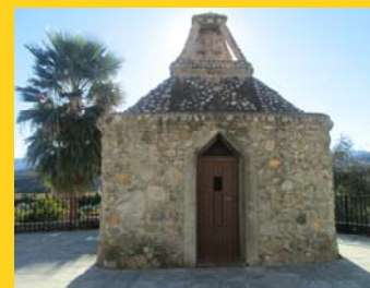
Ermita del Santo Cristo