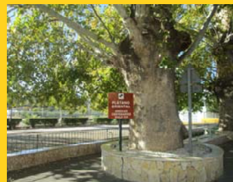
Plátano Oriental centenario