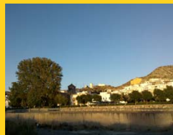
Santa Cruz de Marchena